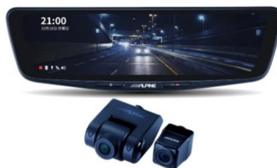
■ DVR-DM1000A-OC (10 型純正ミラー交換タイプ・車外用リアカメラ)