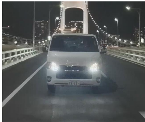
走行時映像イメージ：夜間