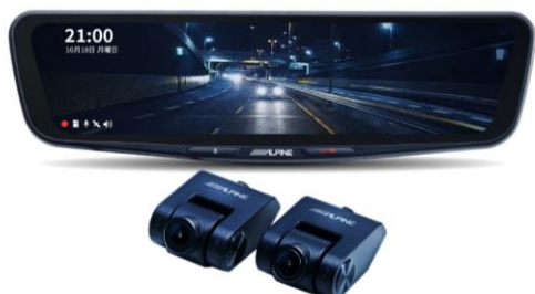
■ DVR-DM1200A-IC (12 型純正ミラー交換タイプ・車内用リアカメラ)