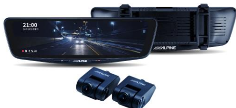
■ DVR-DM1000B-IC (10 型純正ミラーカバータイプ・車内用リアカメラ)