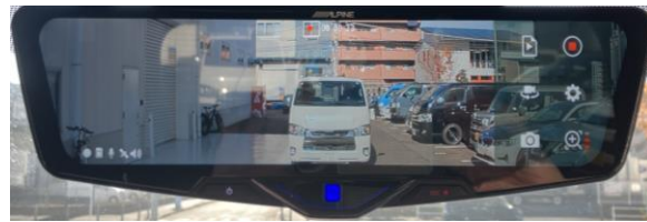
表示 2 : MID ズーム