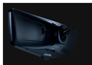
ミラーアーム接続部カバーにより背面も美しく