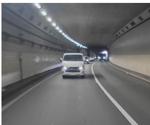
走行時映像イメージ：トンネル内