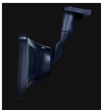
スマートな装着を実現する薄型・スリムでなめらかなデザイン