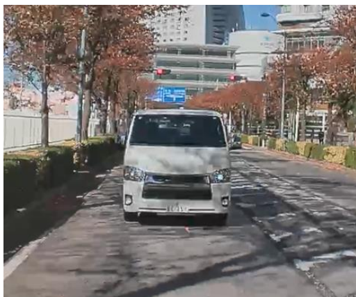
走行時映像イメージ：昼間

リアに STARVIS 2 搭載の 200 万画素フル HD カメラを新たに採用。強化された HDR 機能により、逆光時の白飛びや夜間でのノイズ感を軽減。さらに映像のデジタル伝送で遅延が少なく、これまで以上になめらかな後方映像を映し出します。