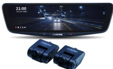
■ DVR-DM1000A-IC (10 型純正ミラー交換タイプ・車内用リアカメラ)