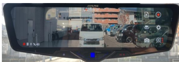
表示 3 : MAX ズーム