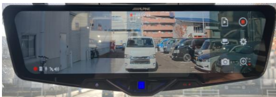
表示 1 : MIN (一般的なデジタルミラー表示)

ミラーでの表示サイズを3段階に調整できるデジタルズーム機能を搭載。アナログミラーにくらべて実際より後方車両が小さく、遠くに見えるというデジタルミラー特有の違和感を軽減します。操作はミラーをダブルタップするだけ。走行状況に応じて瞬時に調整することができます。