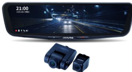
■ DVR-DM1200A-OC (12 型純正ミラー交換タイプ・車外用リアカメラ)