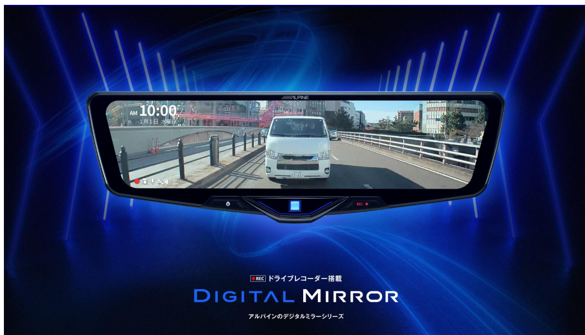
■ DVR-DM1246A-IC 装着イメージ（車両はハイエース：200系）

電子部品、カーエレクトロニクス関連製品の開発・製造・販売を行うアルプスアルパイン株式会社（東京都大田区、泉 英男社長）の国内マーケティング部門であるアルパインマーケティング株式会社（東京都大田区、石田 宗樹社長）は、純正ミラー交換型でスマートな取付けが好評のドライブレコーダー搭載デジタルミラーに、新たなデザインと後方デジタルズーム機能を搭載した新型モデルの追加を発表。2025年1月下旬より順次、全国のアルパイン製品取扱店にて販売を開始いたします。