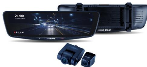
■ DVR-DM1000B-OC (10 型純正ミラーカバータイプ・車外用リアカメラ)

■ DVR-DM1200A-IC ドライブレコーダー搭載 12 型デジタルミラー (純正ミラー交換タイプ/車内用リアカメラ) オープン価格