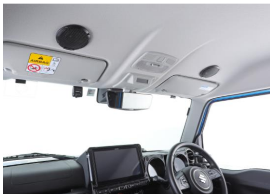
ジムニー/ジムニーシエラ装着イメージ

5cm ルーフスピーカーを頭に近い天井に装着。目の前上方からサウンドが降り注ぐことで、走行中のロードノイズに負けることのない音楽再生を実現。「走っているときに音楽が聴こえない」というご不満を解消して、ドライブ中でも聴きやすいサウンドを実現します。