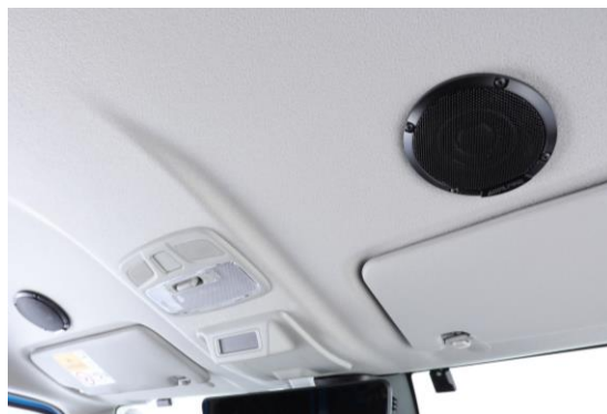
ルーフスピーカージムニー/ジムニーシエラ装着イメージ