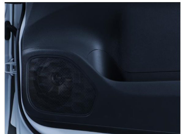
■デリカミニ専用 MetioSound (メティオサウンド) 「MS-165-DM-30」装着イメージ：ドアウーファー