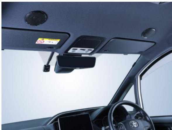
■80系ヴォクシー/ノア/エスクァイア専用 MetioSound (メティオサウンド) 「MS-165-NVE-80」装着イメージ：ルーフスピーカー