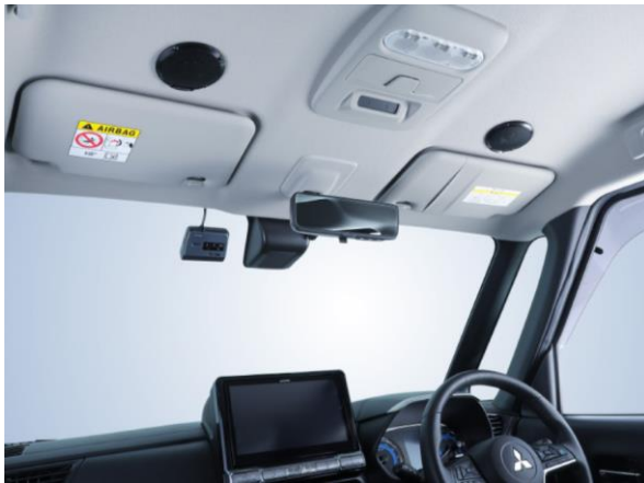
■デリカミニ専用 MetioSound (メティオサウンド) 「MS-165-DM-30」装着イメージ：ルーフスピーカー