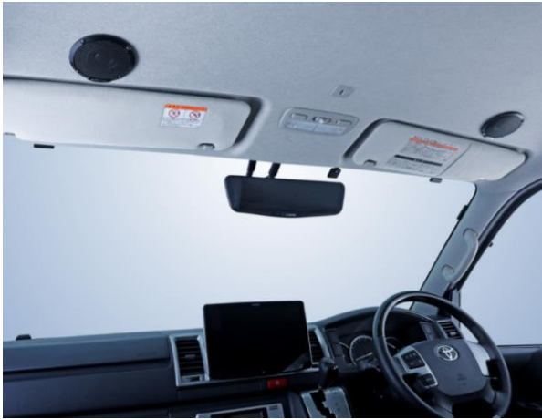
■ハイエース専用 MetioSound (メティオサウンド) 「MS-165-HI-200」装着イメージ：ルーフスピーカー