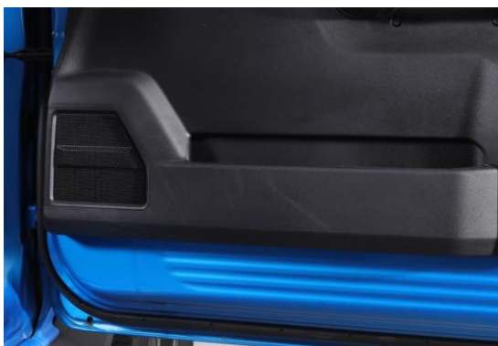
ドアウーファー ジムニー/ジムニーシエラ装着イメージ

16.5cm の専用ドアウーファー（装着用スペーサーまたはバッフルボード付属）は、車室内スペースを犠牲にすることなく重低音再生を実現。ルーフスピーカーによるクリアな中高域と合わせて、特にロードノイズの激しい車種では車室内が楽しく迫力のあるサウンド空間に生まれ変わります。