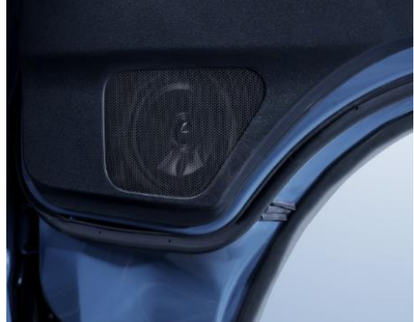
■ハイエース専用 MetioSound (メティオサウンド) 「MS-165-HI-200」装着イメージ：ドアウーファー