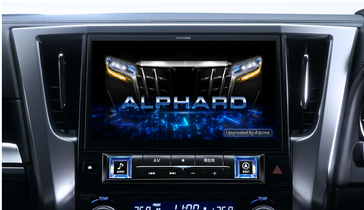
■30系アルファード/ヴェルファイア専用 11型大画面カーナビ ビッグX 11 アップグレード「EX11NX2-AV-30DA-UP」 ※画像はアルファード（後期型：2019(R1)/12～2023(R5)/6）での装着イメージです

※国内で販売されている市販カーナビゲーションとして。2023年11月時点。弊社調べ