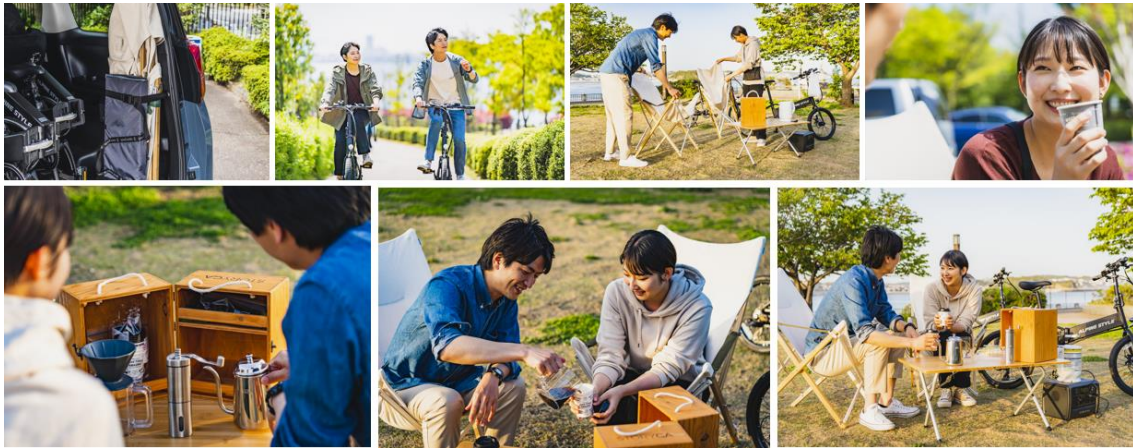
コーヒーセットでブレイクタイム