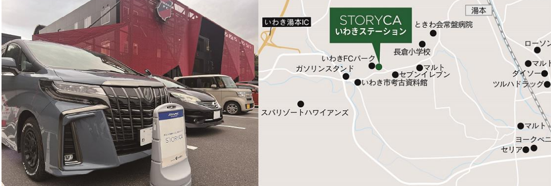
いわきステーション (いわき自転車文化発信・交流拠点ノレル? 前の駐車場)

所在地 : 〒972-8322 福島県いわき市常磐上湯長谷町釜ノ前 1-1 いわき FC パーク 1 階 102 区画