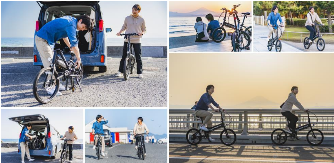
Eバイクを組み立ててポタリング

車両はポタリング仕様に「トヨタ アルファード」をコーディネートしてあります。車両にEバイクが2台積み込まれているため、別途自転車をレンタルする必要がありません。積載されているEバイクは、専用工具を使わずに組み立てられる折りたたみ式。電動アシスト付きで大容量専用のバッテリー搭載となっており、満充電の状態ですら約80kmの長距離走行が可能です。7段変速ギヤに加えて女性でもブレーキングしやすい機械式ディスクブレーキが採用されています。エアレスタイヤを使用しているのでパンクの心配もありません。