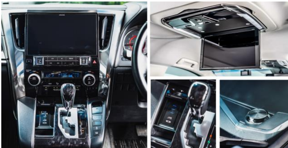
アルパインのカーナビやサウンドシステムなども装備

「STORYCA」では、各 STORY に合わせたアクティビティの道具や装備をセットするのに加えて、車内にはアルパインの大画面のナビゲーションやサウンドシステム、リフトアップ3ウェイスピーカーなどが装備されています。