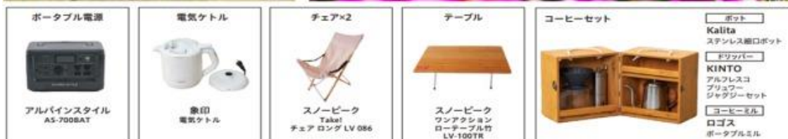
「PUTTERING STORY」 装備品