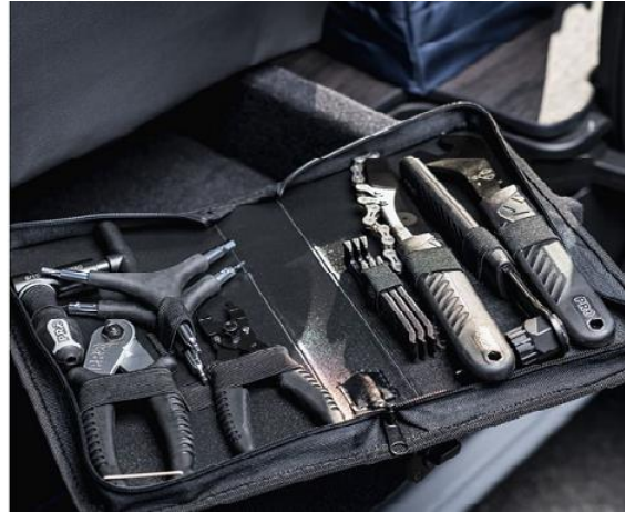
収納ボックスや簡易ツールキットを装備

車両にはサイドオーニングが装着されており、テーブルやチェアも装備しています。仲間とサイクリングロードを走り終わった後休憩したり語り合ったり、団らんスペースとしてもご利用いただけます。