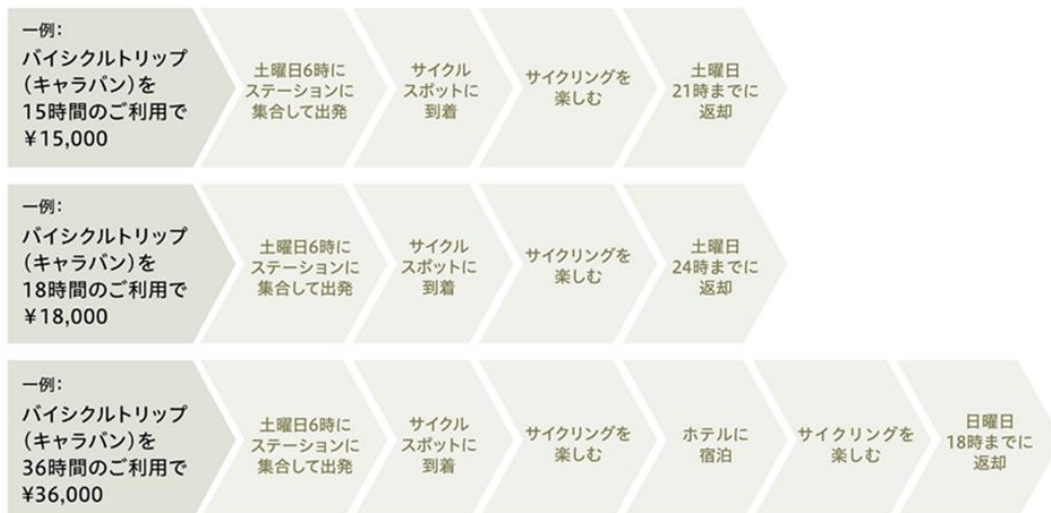
「BICYCLE TRIP STORY」モデルケース