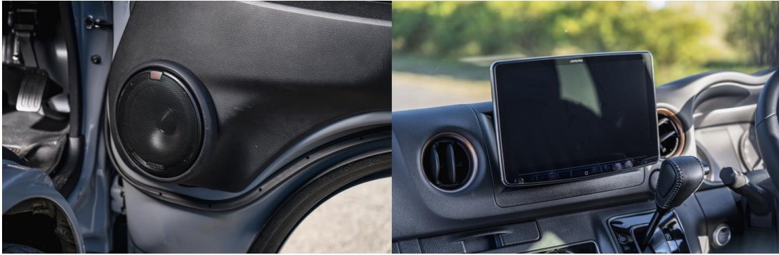
アルパインのカーエレクトロニクス製品を装着