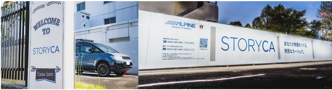
『STORYCA』横浜ステーション