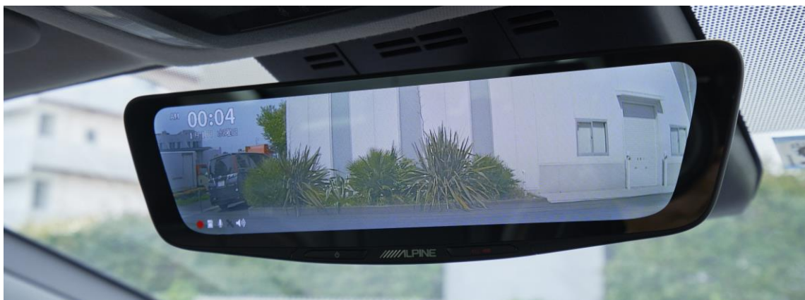
10 型ドライブレコーダー搭載デジタルミラー（DVR-DM1000A-IC）装着イメージ